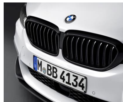
Rejillas M Performance

Las cubiertas en carbono aportan una apariencia más deportiva al exterior del vehículo. Están elaboradas completamente en fibra de carbono y recubiertas con una capa de laca exterior para protegerlas del paso del tiempo y rayones.