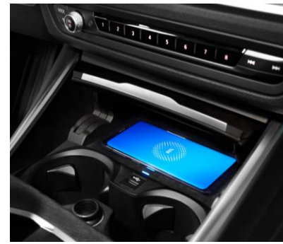
Cargador Inalámbrico BMW

La exclusiva bolsa de respaldo como la bolsa trasera están diseñadas con un material resistente y cuenta con múltiples bolsillos que le permitirán mantener el interior del vehículo organizado.