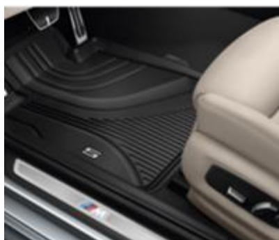
Alfombra Todo Tiempo Maletero

El soporte de aluminio diseñado para las barras de techo BMW permite transportar con seguridad bicicletas de ruta, montaña, playeras y de niños cumpliendo con los más altos estándares de seguridad.