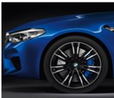
Juego de Rines de Aleación Ligera

El Juego de rines de aleación ligera le dan al vehículo un estilo único, especialmente deportivo. Estos rines de aleación ofrecen un menor peso que los rines que vienen de serie en los vehículos.