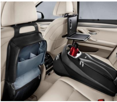
Bolsa de Respaldo y Bolsa Trasera

La alfombra BMW está diseñada con materiales duraderos, con borde en relieve y diseño atractivo que ayuda a proteger la alfombra de la humedad y la suciedad garantizando la mayor protección posible del interior del vehículo.