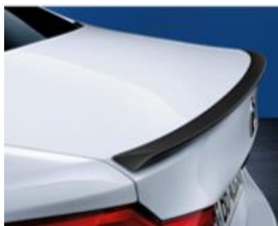
Spoiler Trasero en carbono M Performance

La rejilla "riñonera" negro brillante dará al vehículo un estilo único y deportivo que lo diferenciará de los demás. Es diseñada exclusivamente para cada vehículo siendo resistente a los golpes.