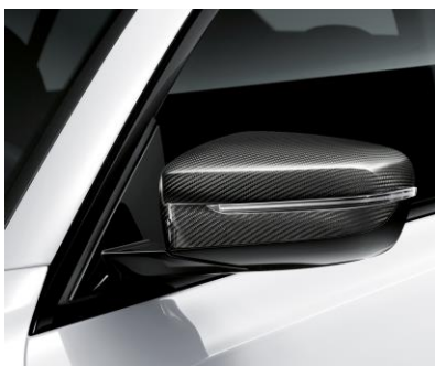
Cubierta de Espejos en Fibra de Carbono M Performance

El Juego de rines de aleación ligera le dan al vehículo un estilo único, especialmente deportivo. Estos rines de aleación ofrecen un menor peso que los rines que vienen de serie en los vehículos.