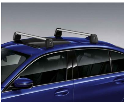
Barras para Techo

El spoiler trasero M Performance da un aspecto más deportivo y atlético. Además, resalta la línea única del automóvil y optimiza las cualidades aerodinámicas.