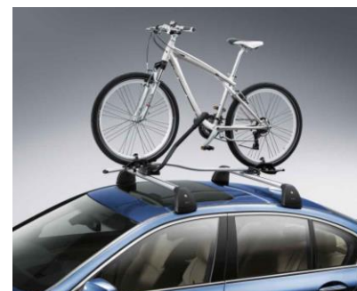
Soporte para Bicicletas

Las barras del techo multifuncionales se instalan en el vehículo de una manera fácil y práctica. Son óptimas para todos los soportes y cajas portaequipajes de techo. Están diseñadas para cada vehículo BMW cumpliendo con los más altos estándares de seguridad.